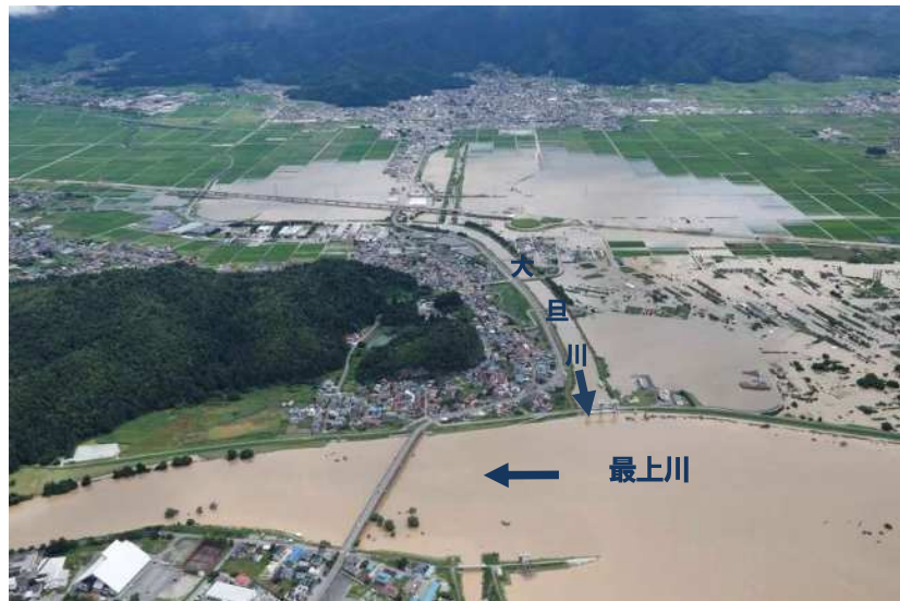
一級河川大旦川（令和2年7月浸水被害状況）

大旦川（村山市）において、河道改修と併せて計画目標相当の洪水を安全に流下させるため調節池を計画し抜本的な治水安全度の向上を図る。