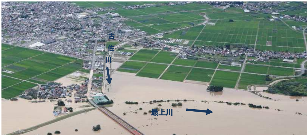
一級河川古佐川（令和2年7月浸水被害状況）