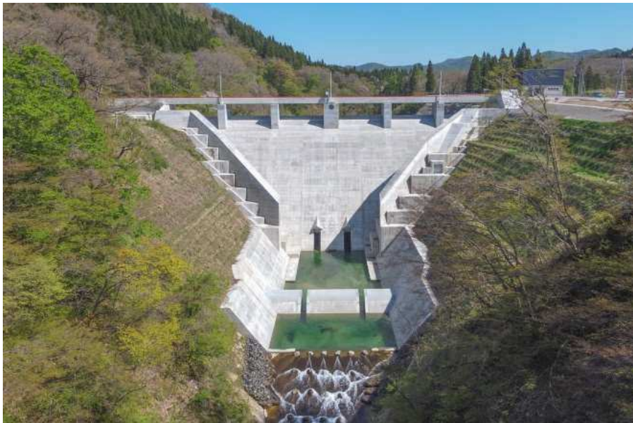
最上小国川流水型ダム（令和2年3月竣工）

また、平成20年度に最上小国川流水型ダム（最上町）の建設事業に着手し、令和元年度に完成した。