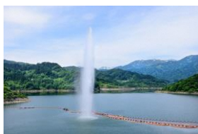
月山湖 大噴水 (イメージ)