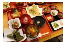
山菜御膳 (イメージ)