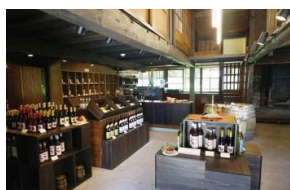
トラヤワイナリー (イメージ)