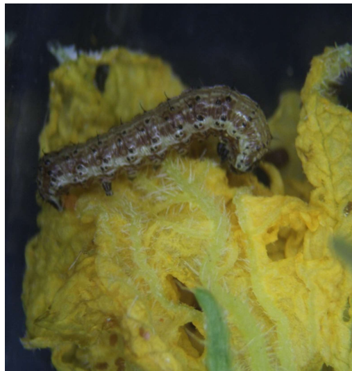
図2 メロンの花を加害するオオタバコガの幼虫 (令和6年6月3日撮影)