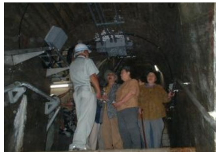
▲ダム監査廊内の見学