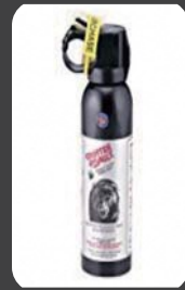
クマ撃退スプレー

④ 万一、クマに出合ったら、背を向けずに、ゆっくり後退してください。(クマ撃退スプレーの使用も有効です。)