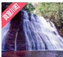
真室川町 不動明王の滝