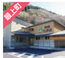
最上町 道の駅もがみ