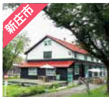
新庄市 エコロジーガーデン

新庄・最上地域の8市町村をぐるっと巡るデジタルスタンプラリーを開催! スマホやタブレットから、アプリダウンロード不要で簡単に誰でも参加できます。スポットは通常スポット60ヶ所、特別スポット6ヶ所(新庄まつり期間限定スポット・最上川舟下りスポット各3ヶ所)の計66ヶ所を配置! 新庄・最上をたくさん巡って、豪華賞品を当てよう!