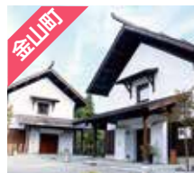
金山町 マルコの蔵