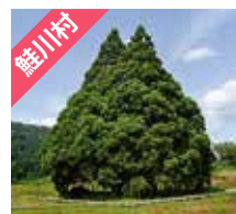
鱒川村 小杉の大杉