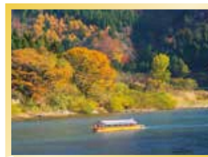
特別スポット/最上川舟下りスポット