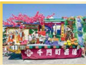
特別スポット/新庄まつり期間限定スポット