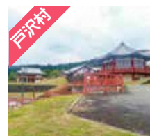
戸沢村 道の駅とざわ