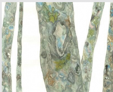
大窪 美咲 (おおくぼ・みさき)

1982年神奈川県生まれ。2007年多摩美術大学 絵画学科日本画専攻卒業、2009年東京造形大学大学院 造形研究科 造形専攻美術研究領域修了。普段から山に登り、その山や森で得たイメージや感覚・季節や天気などを風景や植物などと混ぜ合わせてペン画・水彩などで絵画制作をしています。東京を中心に個展多数。