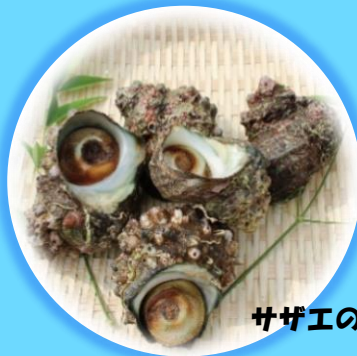
ガサエビのつぼ焼き