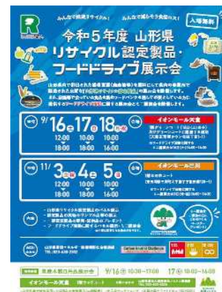
リサイクル認定製品展示会チラシ