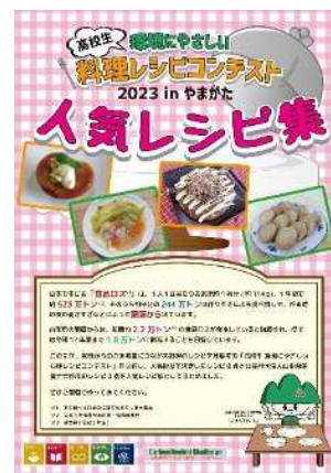
「高校生環境にやさしい料理レシピコンテスト」 人気レシピ集