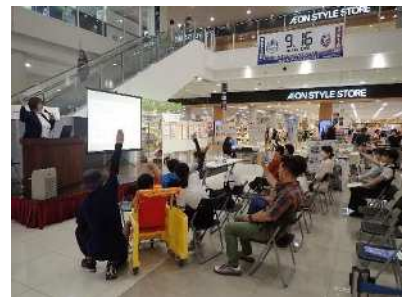
実践者のミニ講演会