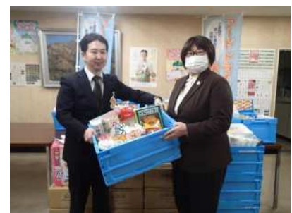
県庁舎フードドライブ