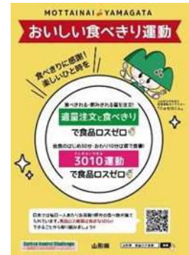
POPスタンド挿入用チラシ