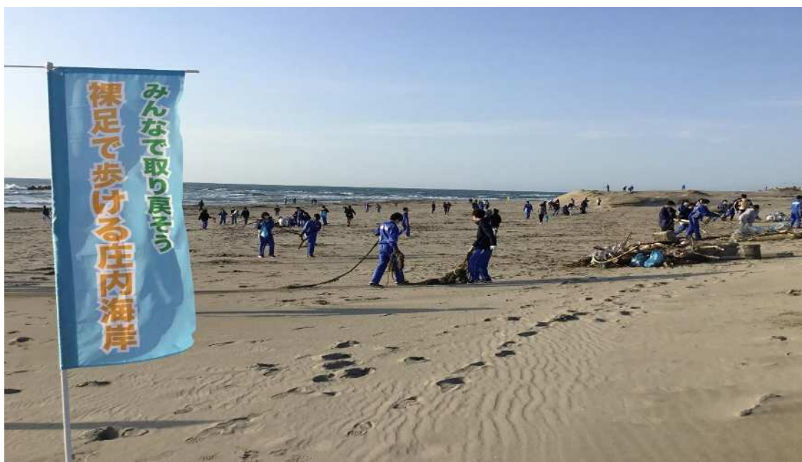
「美しいやまがたの海クリーンアップ運動」の様子