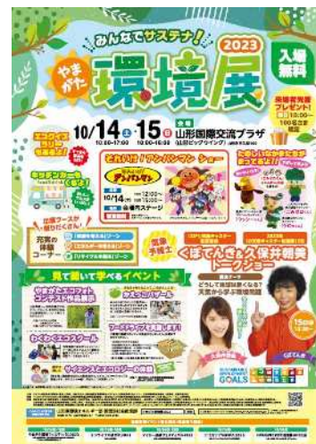
やまがた環境展ポスター