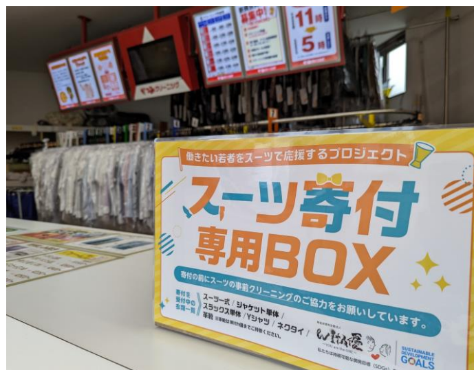
寄付専用BOXを店舗内に設置