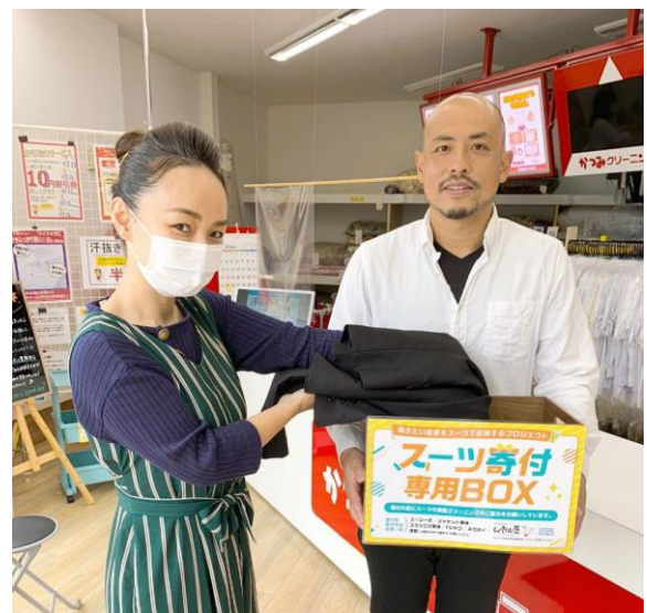
スーツの寄付をいただいている様子