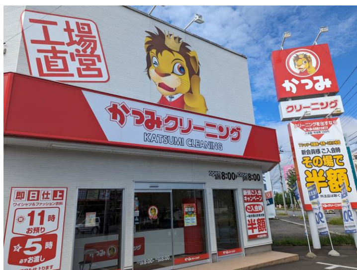
連携先の「かつみクリーニング」

中学や高校等では制服のお下がりが必要な方にお渡しする仕組みはあるが、社会に出る上で必要なスーツやネクタイ等を安価に購入できる仕組みがない。本事業では、地域に密着したクリーニング店の協力を仰ぎ、自宅に保管している着用回数が少なく、綺麗なスーツを寄付いただくことで、若者の自立の一步を支えていただくような中古スーツのマッチング事業の基盤づくりを行った。