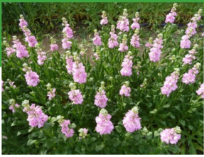
村山の初冬を香り高く彩る ストックです