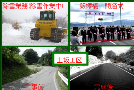
除雪業務(除雪作業中)