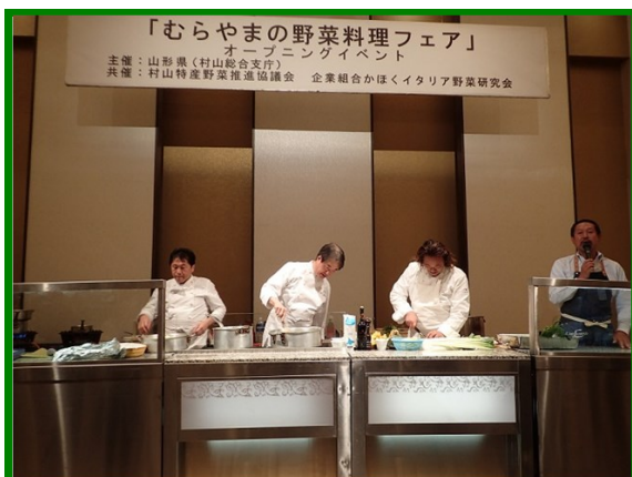
豪華顔ぶれのシェフらによる調理実演

村山地域の協賛レストランにおいて村山地域の伝統野菜・特産野菜を使ったオリジナルのイタリア料理を楽しむ「むらやまの野菜料理フェア」のオープニングイベントが、11月8日、山形市のパレスグランドで、地元のシェフや流通・販売関係者、生産者を対象に開催されました。