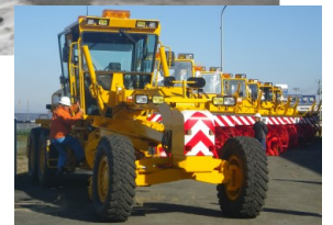
H28. 11. 11 除雪車出動式 (西田車両基地)