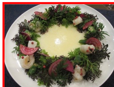
イタリア野菜を使った、クリスマスリースに見立てたサラダ