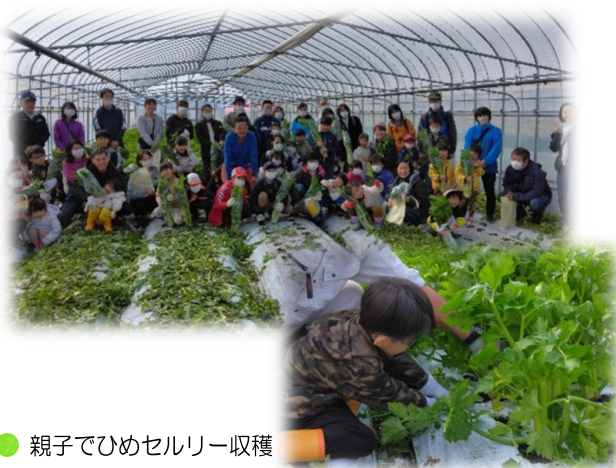
● 親子でひめセルリー収穫

農業体験を通して地域の農業や農作物について興味関心を高めるため、幼児・児童を対象にした『セルリー収穫体験』を行いました。