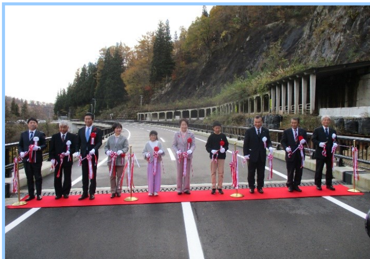
● 開通式（R5.11.19）知事、町長、地元の小学生などが出席