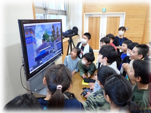
● ドローンシミュレーター 操作の様子（東小）

日本技術士会主催の出前授業が、10月10日に山形市立東小学校（4年生65名）、11月6日に天童市立津山小学校（6年生24人）で開催されました。