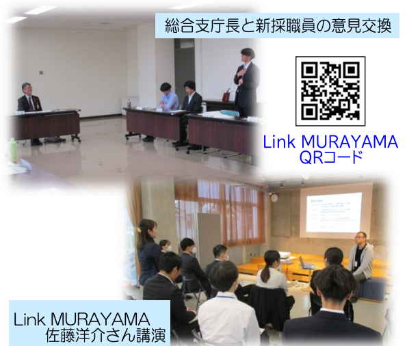
総合支庁長と新採職員の意見交換