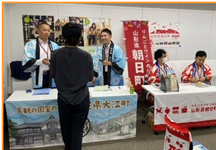
● 市町個別相談ブース