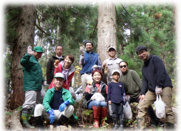
● 「原木なめこ収穫体験」参加者（寒河江市幸生地区）