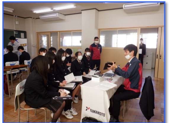
● 企業探求セミナー（村山産業高校）