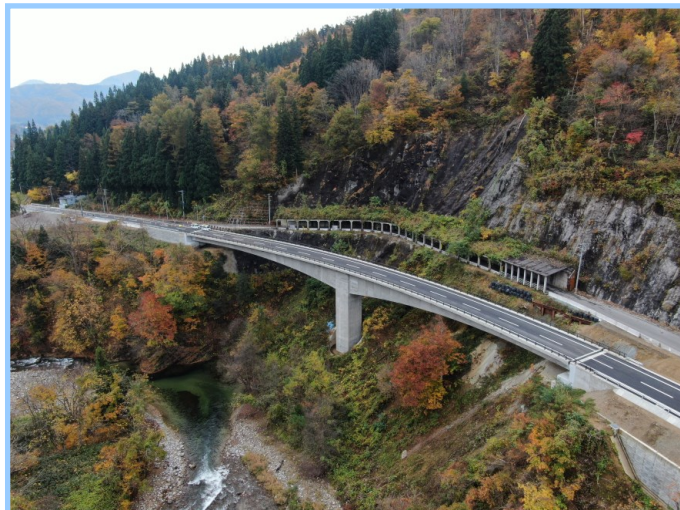
● 県道289号白滝宮宿線 道陸橋 全景