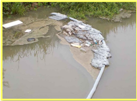
河川に設置したオイルフェンス