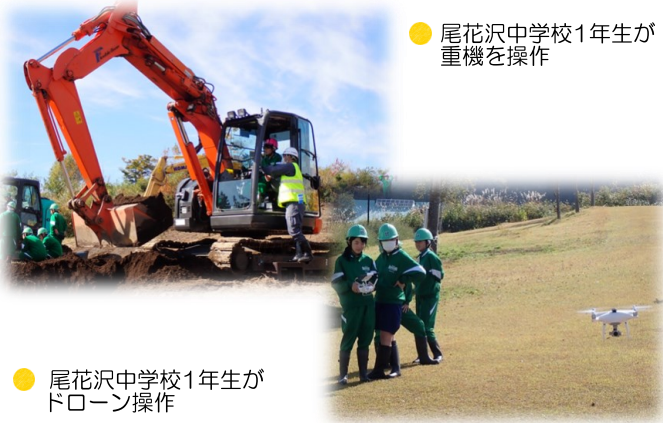
● 尾花沢中学校1年生が重機を操作