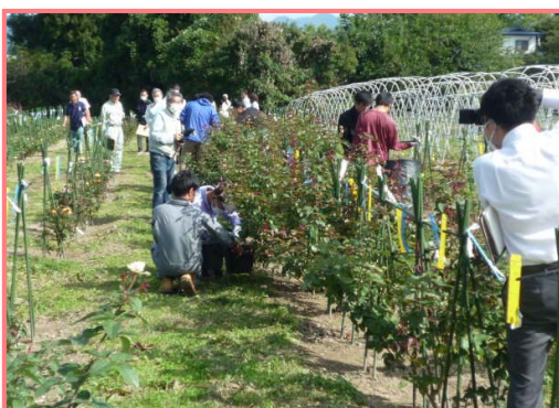
● （株）バラの学校（村山市）の現地視察

農福連携の普及啓発、「農業と福祉」お互いの理解促進を推進するため、10月4日（水）に農業・福祉関係者が参加し農福連携「現地視察研修会」を行いました。現地視察は（株）バラの学校（村山市）に協力をいただき、食用バラ圃場での障がい福祉サービス事業所「つながるアカデミー」の利用者による収穫作業等を見学しました。