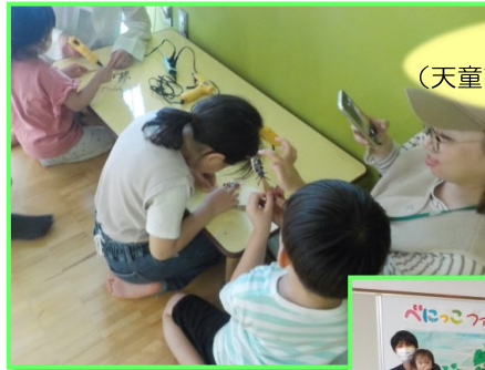
積木づくり （天童市子育て未来館げんキッズ）