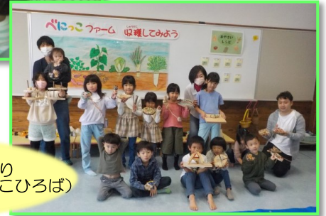
アイススプーンづくり （山形市児童遊戯施設べっこひろば）