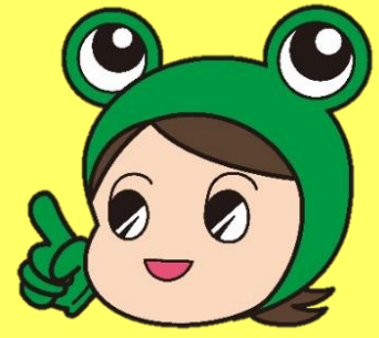
県消費生活センターキャラクター ケロちゃん