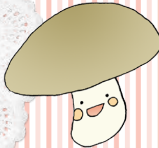
シメタケ(原木・菌床)