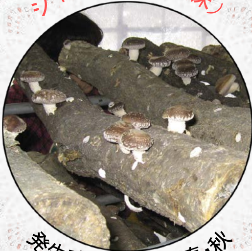
発生時期(原木): 春・秋