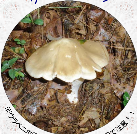
ワサウラベニタケ