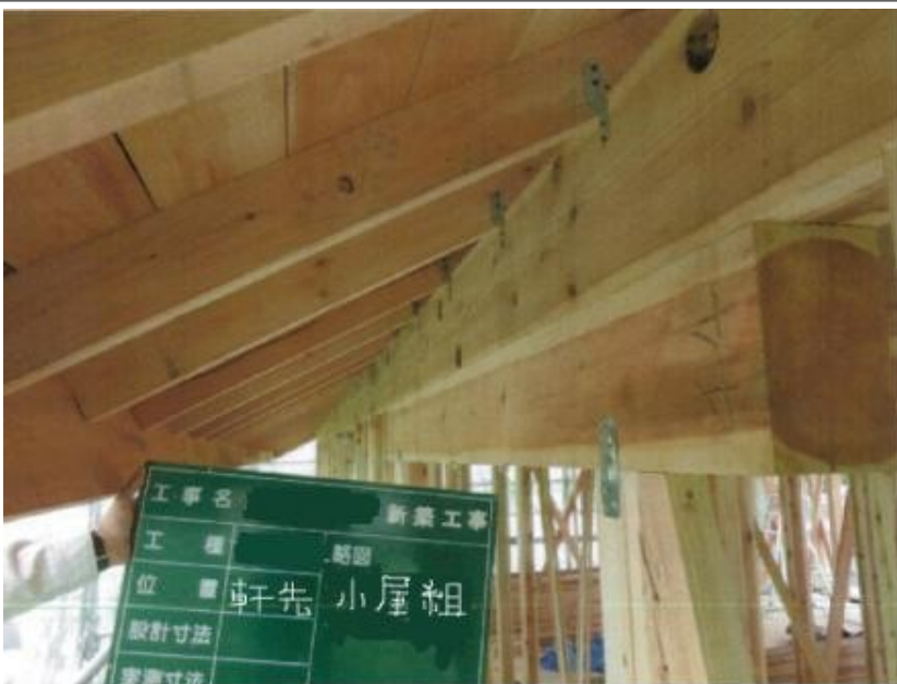
小屋組み完了 軒先部