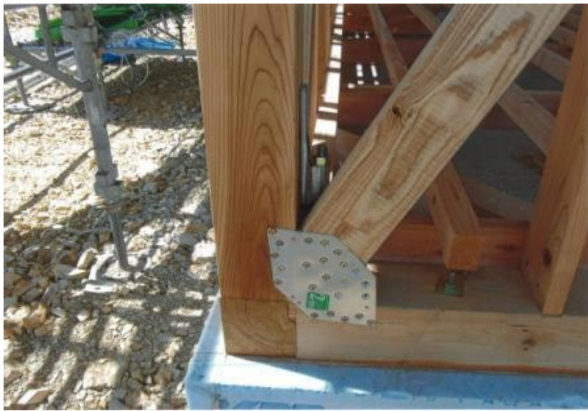
主要な軸組み完了 下部