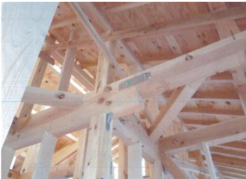
小屋組み完了 継手、仕口部