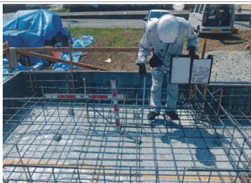
基礎配筋完了 検査状況 アンカーボルト及びHD金物 用ボルト設置状況