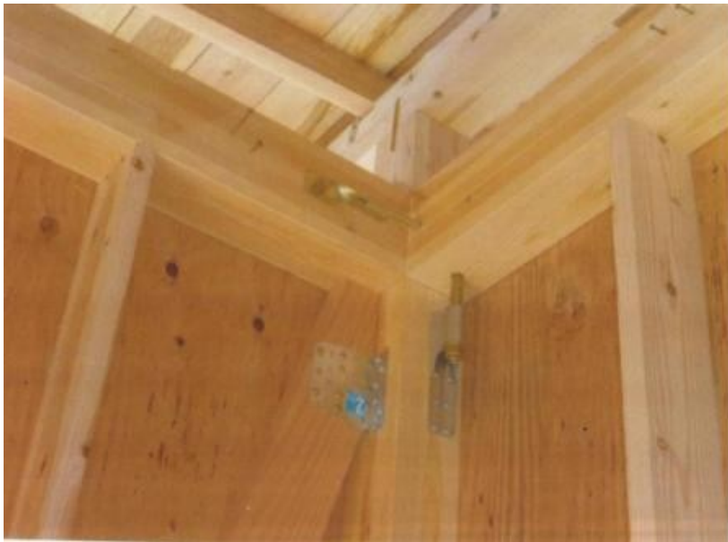
主要な軸組み完了 上部