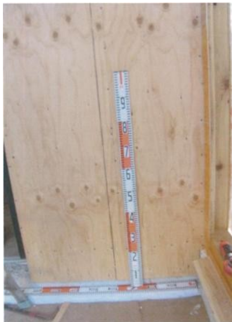
耐力壁完了 釘間隔