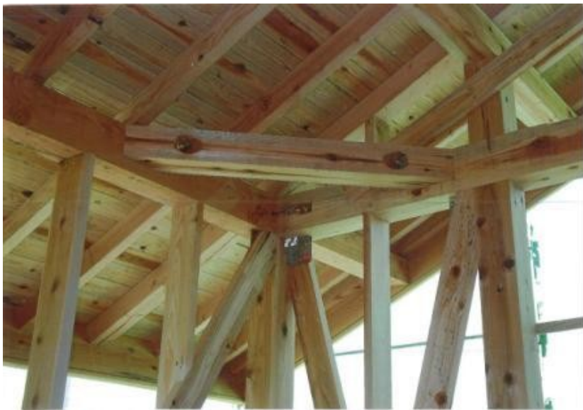
小屋組み完了 火打ち、仕口部