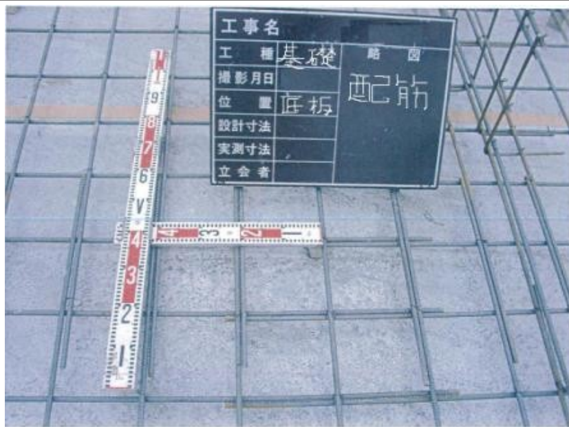
基礎配筋完了 底板部