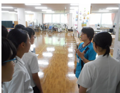
見学の様子② (リハビリテーション科)