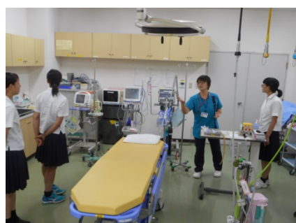
見学の様子① (救急外来室)