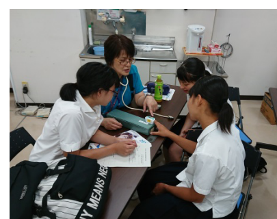
指先での脈拍測定