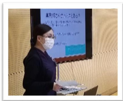
薬剤師による講話

生徒の皆さんからは、「私が知っていたこと以外の仕事内容も知ることができて、医療関係のしごとへの関心を深めることができました。」「今まで持っていたイメージとは全然違って面白かったです。」「いろいろなものを体験し使ってみたり、実際に話を聞いたりできてよかったです。」といった感想が寄せられました。