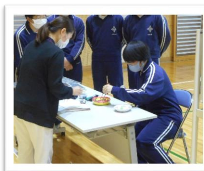
作業療法士による体験 (特殊な食器の体験)