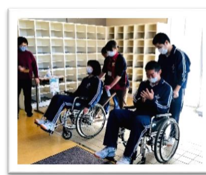
介護福祉士による体験 (車いす体験)