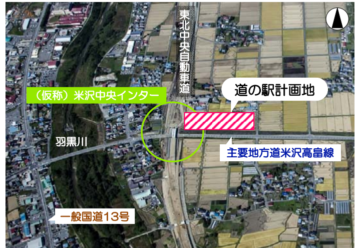
道の駅「よねざわ(仮称)」計画地 (米沢市川井)

今年度から、測量設計を皮切りに事業に着手し、同自動車道福島～米沢北間の開通に合わせて、平成29年度にオープンすることを目指して事業を進めていきます。