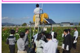
ダリア園地の拍動自動灌水システム

桜の便りとともに、いよいよ春の農作業本番を迎えました。農業技術普及課では、平成28年度を目標とした「置賜地域農林水産業元気再生戦略プロジェクト」の実現に向け、水稻「つや姫」の高品位安定生産をはじめ、大粒ぶどうの「シャインマスカット」、「アスパラガス」、「ダリア」等の園芸品目の一層の産地拡大、畜産の若い後継者育成、農産物直売所の魅力づくり、トップランナー育成、6次産業化等を含めた重点プロジェクトに取り組んでいます。また、新たな米政策に対応した取組支援も強化します。(農業技術普及課)