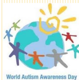
World Autism Awareness Day