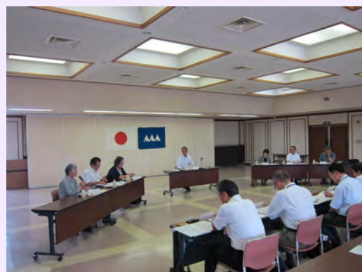
知恵袋委員会の様子

なお、委員からのご意見やご提案は、今後の施策を展開するうえで参考にさせていただきます。