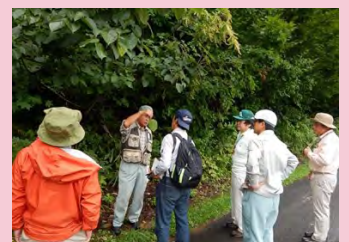
森の案内方法の受講の様子

2回目の講座は、10月27日(土)に開催を予定しています。森に興味がある高校生以上の方であればどなたでもご参加いただけますので、是非ご参加下さるよう、お願いいたします。(森林整備課森づくり推進室)