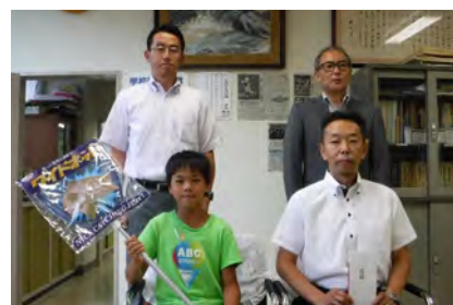
米沢市立関根小学校のみなさんと