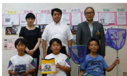
南陽市立漆山小学校のみなさんと

きました。今後は、「総合的な学習の時間」に、贈呈された物品を使っての水中観察や水質調査等が予定されています。