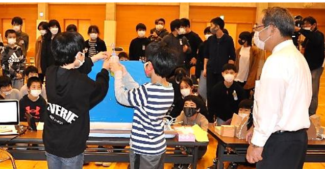
模型を用いて地すべりが起きる仕組みを体験