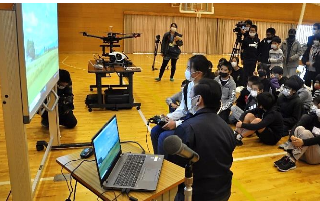
ドローンのフライトシミュレータ操作を体験

小学生に建設分野の仕事の魅力をってもらうため、日本技術士会山形県支部との共催で、11月12日(金)南陽市立宮内小学校の6年生60名を対象に、「土木のふしぎ、教えます」「災害から命を守る」と題して出前授業を開催しました。