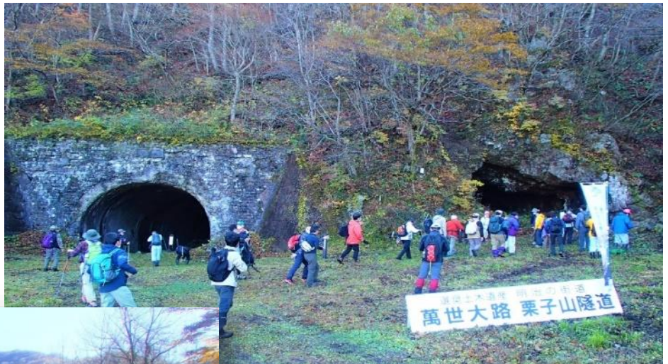
初代(右)、2代目(左)栗子隧道前の様子

出発式では、現在道の駅米沢に移設されている栗子隧道碑記を写した布媒体(高さ3.5m、幅1.35m)の披露が行われ、改めて碑記の大きさに一同感嘆しました。