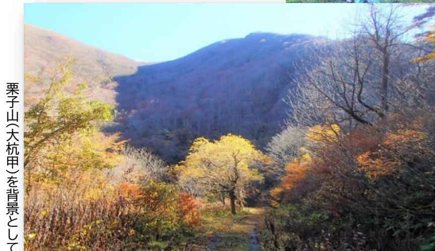
栗子山(大杭甲)を背景として

その後、米沢側と福島側のルートを歩きましたが、これ以上ない好天に恵まれ、足元の落ち葉を踏みしめる音も心地よく、名残の秋の穏やかな1日を参加者44名全員満喫することができました。