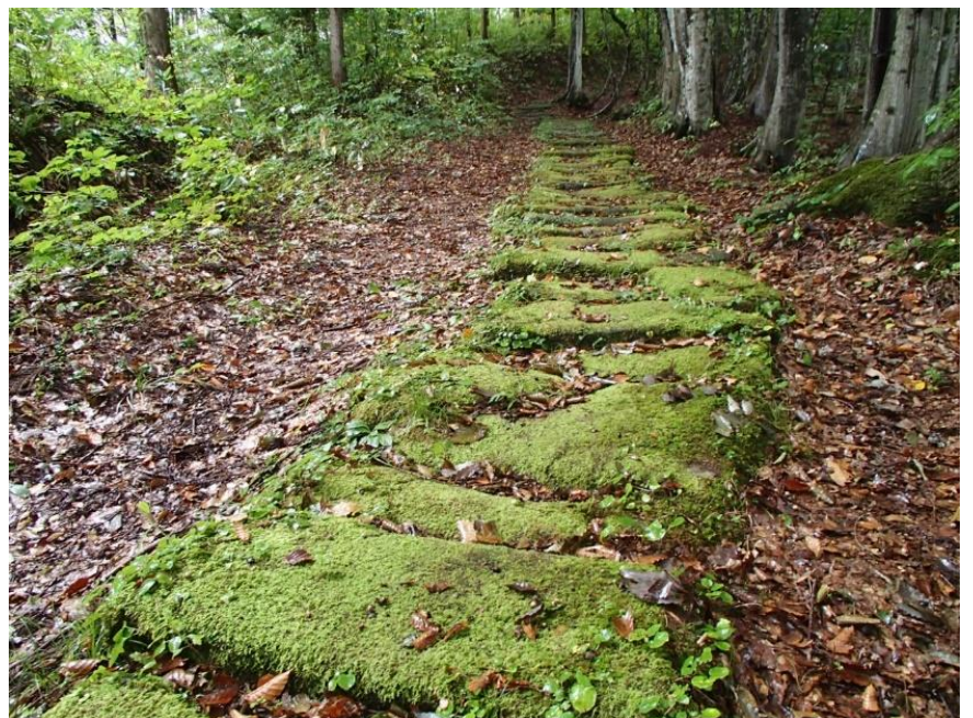
雨に映える苔が美しい敷石道

皆様も是非この身近で静寂に包まれた観光スポットを訪れてみてください。明瞭な四季の移り変わりの中に悠久に在り続ける風雅な古道を堪能できることでしょう。