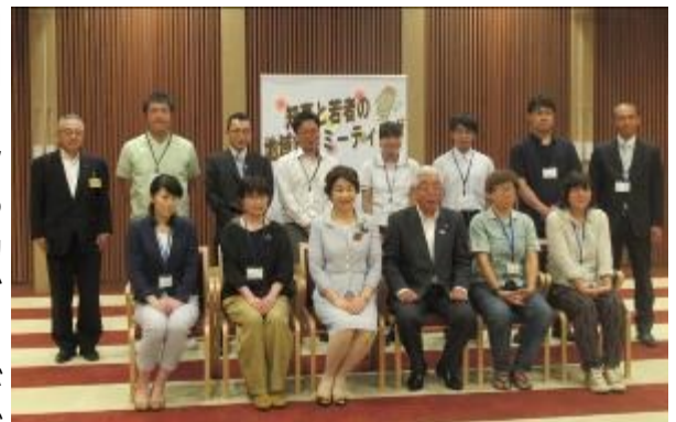
** 参加者の皆さまと **