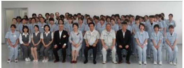
** 社員の皆さまと **