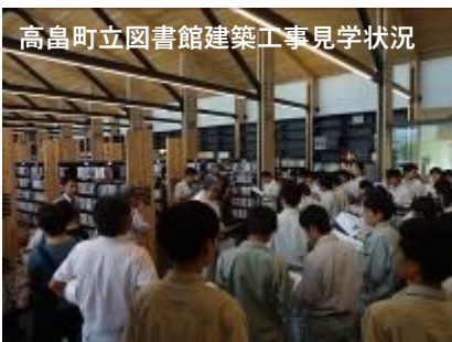
高島町立図書館建築工事見学状況

将来の建設分野を担う若手技術者の就業促進、早期離職防止を図り、建設業が果たす役割や地域貢献性などを学んでもらうため、県立米沢工業高校建設環境類1年生を対象に（一社）山形県建設業協会米沢支部主催の高校生現場見学会を6月21日に開催しました。