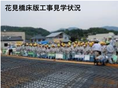
花見橋床版工事見学状況