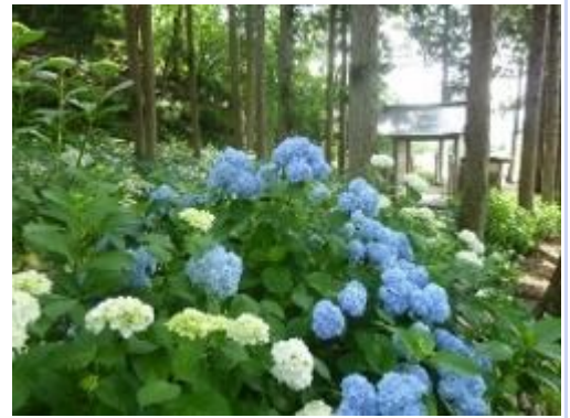
瑞雲院のあじさい(米沢市)

置賜地域の観光情報ポータルサイト「おきたまJ P」では、各地の花や地域のイベント情報が随時更新されていますので、ぜひチェックしてみてください。