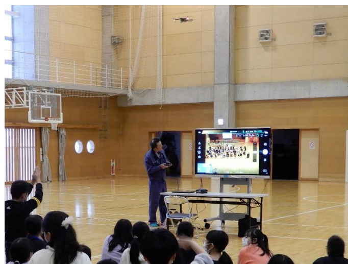
ドローンの実機飛行・撮影