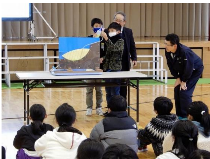
地すべりの仕組み