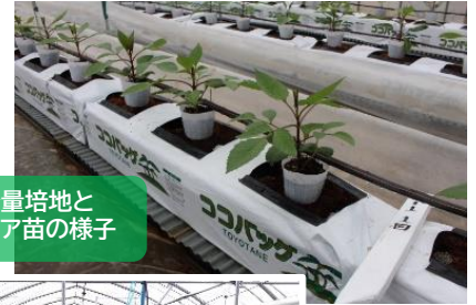
封入ヤシ殻少量培地と定植時のダリア苗の様子