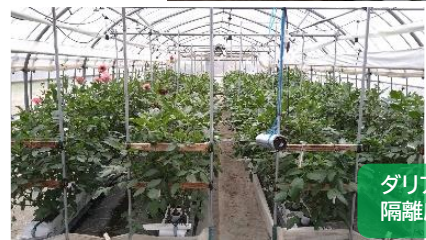
ダリアの隔離床栽培の様子