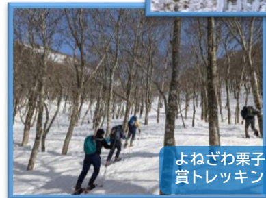
よねざわ栗子峠氷筍鑑賞トレッキングツアー