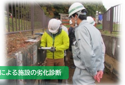
試験機材による施設の劣化診断