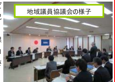
地域議員協議会の様子

質疑では、台風19号に係る復旧事業、定住自立圏構想の取組み状況や課題、企業等の事業承継の現状、やまがた冬のあった回廊キャンペーンの取組み内容、高齢者福祉施設の適性な運営など、県政全般について活発な議論が交わされました。