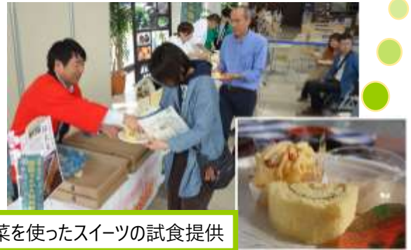
伝統野菜を使ったスイーツの試食提供

イベントでは、来場者の皆さんに伝統野菜の特徴や美味しさを紹介した後、「馬のかみしめ」のバターロールケーキ、「宇津沢かぼちゃ」のモンブラン、「紅大豆」のプリンを試食提供を行い、約100名の方に普段とはひと味違う伝統野菜の魅力を堪能していただきました。