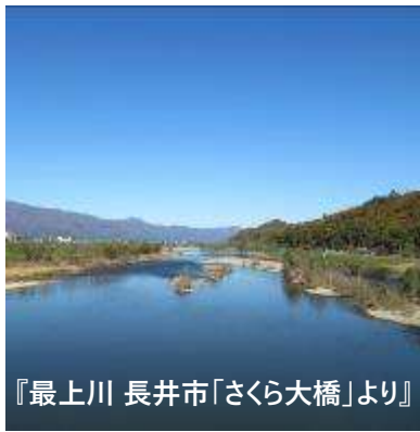
『最上川 長井市「さくら大橋」より』