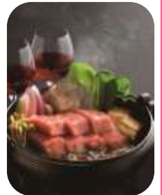
すき焼きとワイン

☎ やまがた冬のあった回廊キャンペーン実行委員会事務局（置賜総合支庁観光振興室内） ☎ 0238-26-6046