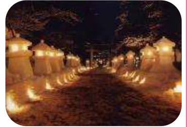
上杉雪灯籠まつり