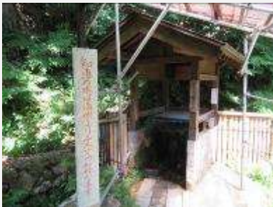
知恵の水（利根水）（高畠町亀岡）

令和元年度「里の名水・やまがた百選」に、置賜地域から「館清水（たてしみず）」（米沢市広幡町）「知恵の水（利根水）（ちえのみず（りこんすい））」（高畠町亀岡）の2か所が選定され、置賜地域は10か所（県内53か所）となりました。里の名水は来年度以降も選定予定です。湧水の情報があれば、環境課まで、ぜひお寄せください。