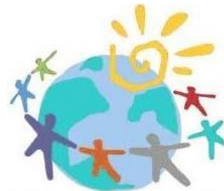
World Autism Awareness Day

自閉症をはじめとする発達障がいについて理解を深めることは、発達障がいのある人だけでなく、誰もが