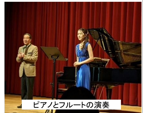
ピアノとフルートの演奏