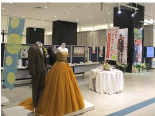
令和5年度庄内地域合同・結婚相談会の様子

このような状況に歯止めをかけるため、庄内総合支庁では、昨年度初めてイオンモール三川を会場に管内市町と合同の結婚相談会を開催しました。当日は多くの方にご来場いただき、一定の成果を上げることができました。