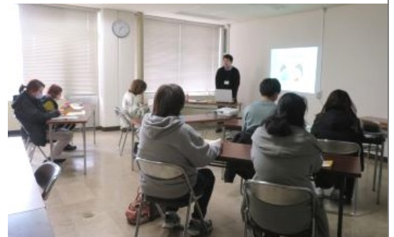
R6.3 譲渡前講習会の様子

平時は「動物愛護の活動拠点」として適正飼養講習会や譲渡動物のマッチング等の事業を推進し、災害時は迷子犬等を収容するなど「被災動物の救護拠点」としても機能することとなります。令和6年度に建設し、令和7年4月の稼働を目指します。