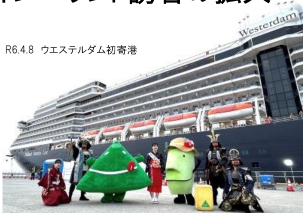
R6.4.8 ウェステルダム初寄港

観光分野では、インバウンドの再開により、欧米や台湾、韓国等からの入込みが徐々に増え、今年度は、外航クルーズ船が7隻と過去最大の寄港が予定されるなど、インバウンド全体が回復の流れにあります。この好機を活かし、国際チャーター便、庄内空港の期間増便(5便化)の利便性を活かした誘客や、国際線定期便が再開した近隣空港等からの誘客など、庄内地域へのインバウンド拡大に向けて、多彩な観光資源を活用した誘致プロモーションや情報発信などにより、誘客対策の強化を図ります。