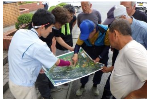
「スマートつや姫」生育診断マップを印刷して現地指導に活用