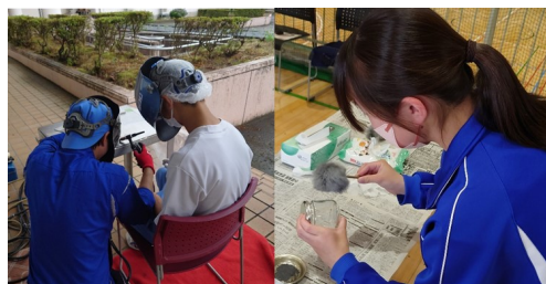
WAKU WAKU WORK

令和6年度も大学生向けの取組を強化し、「庄内地域版企業情報ガイドブック」Web版閲覧用の二次元コードを記載したカードを若者向けのイベントなどで配布するなど、更なる地元企業の魅力発信、庄内での就職を考えるきっかけづくりを実施していきます。