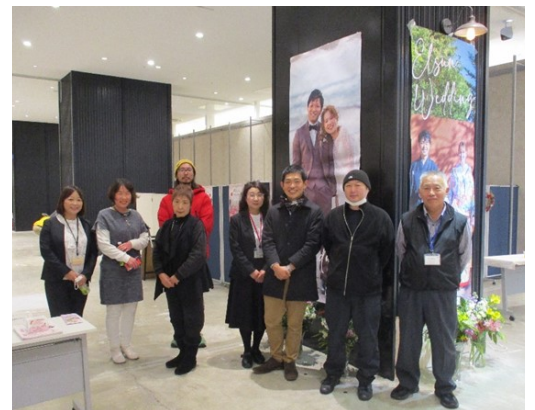
当日相談を受付した管内のボランティア仲人のみなさん

今年度も結婚相談会の開催を予定しているほか、新たに『やまがた縁結びたい』などのボランティア仲人の人材育成のための講座や、市町と連携した婚活イベントなどを実施することにより、結婚を希望する方の出会いの機会の拡大に取り組んでまいります。