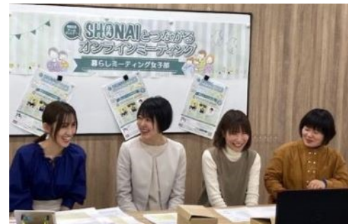
令和5年度のオンライン交流会の様子

庄内地域で自分らしくイキイキと暮らす先輩移住者との交流を通して、庄内地域の魅力をアピールし、移住への興味関心を深めるとともに、移住を検討している方の不安の解消を図り、移住定住を促進していきます。