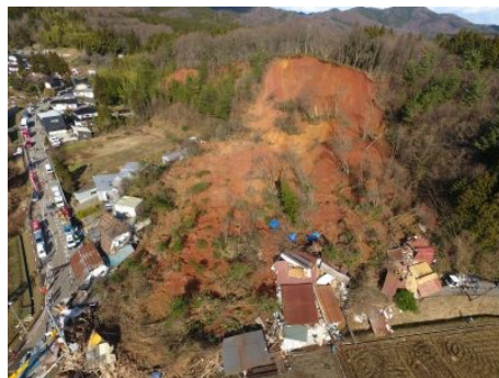
発生時の写真