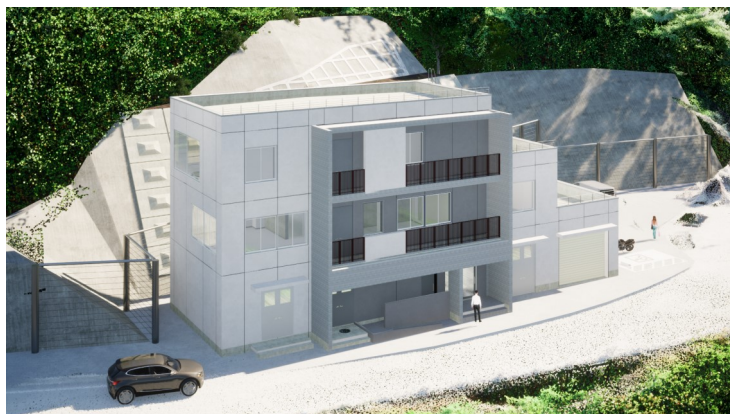
荒沢ダム管理新庁舎 完成イメージ図

※BIMとはBuilding Information Modelingの略で、3Dモデルをベースに建築物の情報を一元的に管理し、設計変更や数量計算、コスト管理などを効率的に行うことを可能にする、ソフトウェアや仕組みを意味します。