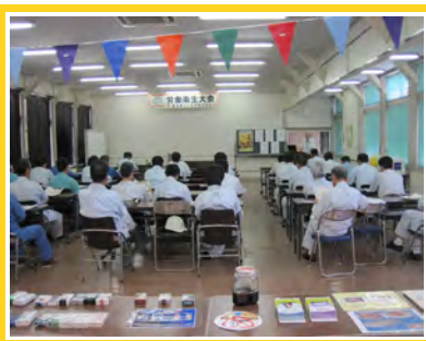
9月26日開催 衛生大会の様子

社員のA氏は、喫煙所設置と同時に禁煙を決意し、現在も継続中との事。会社の取組で社員が行動を変えた体験談が聞けました。