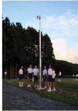
(夕方に点された電灯)