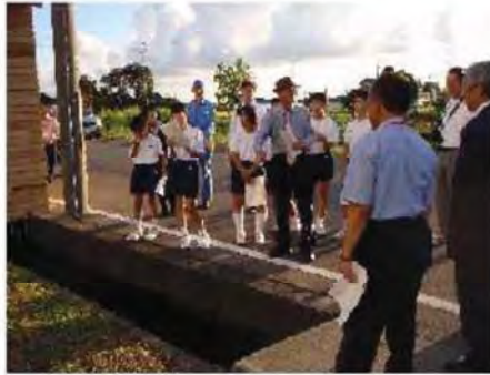
(説明を受ける関係者)

発電の仕組みを自転車を漕いで体験した後、中学生による点灯が行なわれました。 設置には、「緑の分権」という事業による補助が利用されています。