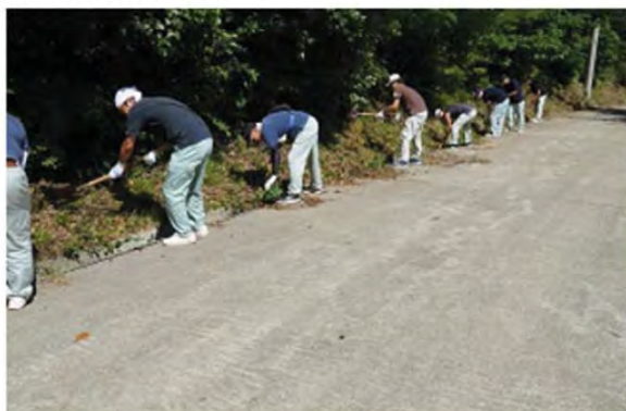
一列に並んで泥上げ

平成24年から始めたボランティア活動は、今回で7回目。これまで延べ110名程の職員が参加してきました。