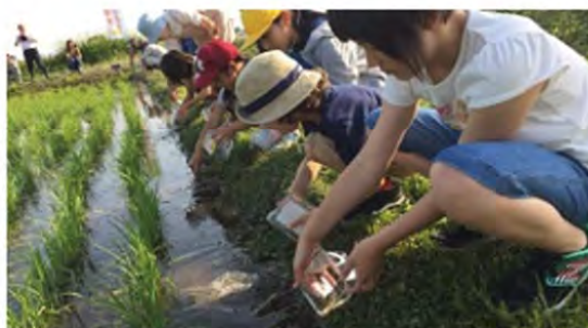
一斉にめだかを放流