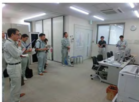
赤川用水管理センター

6月28日(金)に開催された、庄内赤川土地改良区 管内研修に参加し、土地改良施設巡りを行いました。