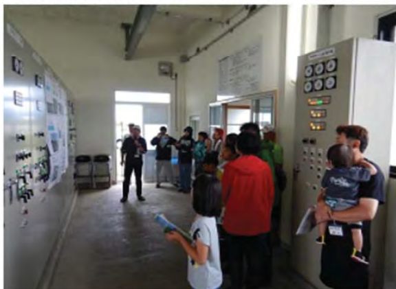
八栄島第一揚水機場見学

八栄島第一揚水機場・ファームポンドについての学習や、親水カヌー体験、さらには、AEDを使った救命講習会が行われました。