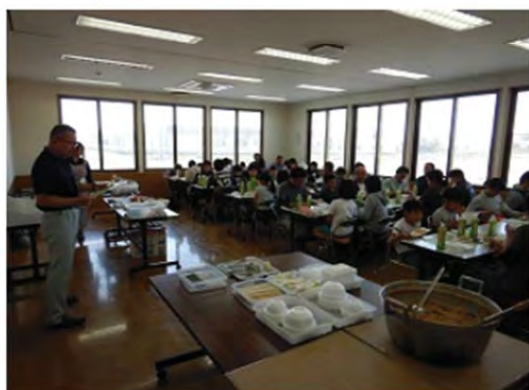
クイズ大会の様子