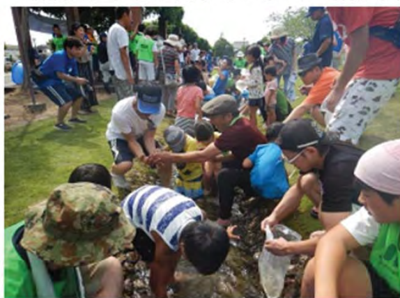
水路が埋まるほど人が集まりました

魚のつかみどりを実施した水路は、赤川から取水した水を、農業用水として運ぶ大事な水路です。