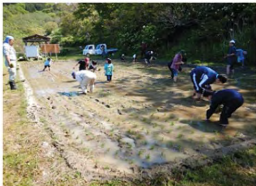
みんなで一斉に田植え

5月12日(日)に、山形県内で唯一海が見える棚田「暮坪」で田植えが行われました。