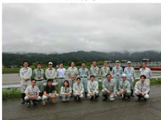
赤川頭首工をバックに集合写真

あいにくの降雨により、楽しみにしていた朝日の山奥にある天保堰を見ることができず、残念でしたが、他の歴史ある施設や、CCTVカメラ、遠隔操作が可能な施設などの最新技術を見ることができ、いい機会となりました。