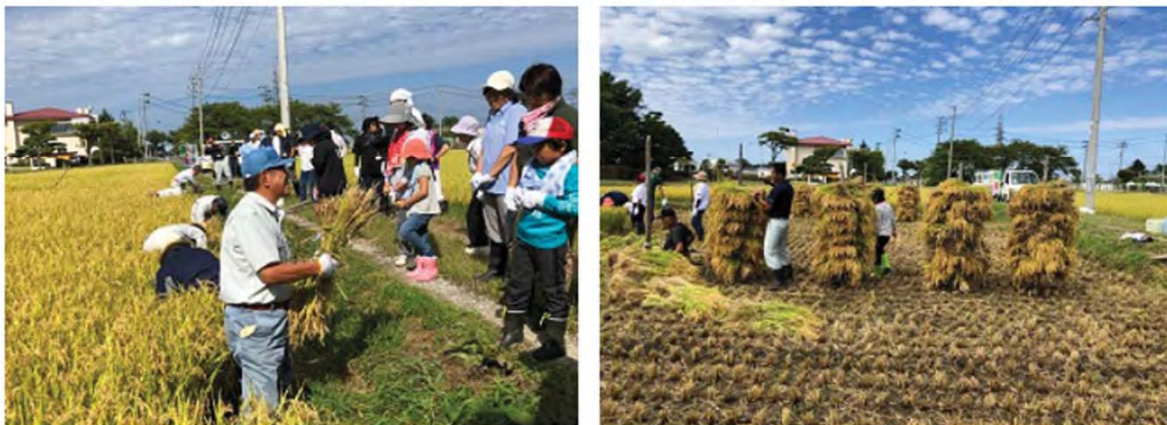
まずはベテランスタッフのお手本披露 くい掛けまで全て手作業で頑張りました

作業が終わった後は、つや姫、雪若丸、ゆめぴりかの3種類のおにぎり。醤油、味噌、塩の3種類の芋煮をそれぞれ食べ比べました。