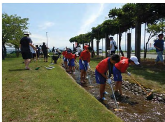
まずは、ブラシで水路の底を磨きます

当日は、余目中学校の生徒や鶴岡市、国営事業所や山形県の職員などがスタッフとしてお手伝いをしました。