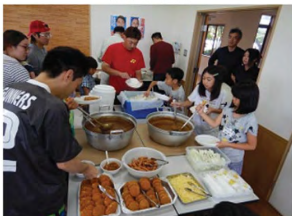
最後は美味しいカレー & クイズ大会