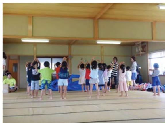
泉保育園の園児によるお礼の踊り

ペットボトルイカダ乗り、プール遊び、おもちゃすくい、水鉄砲遊びなどが用意され、一番人気はプール遊びでした。