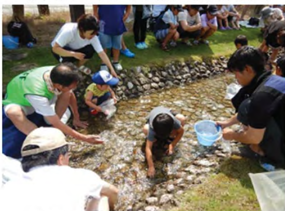
未就学児童の部門は、金魚です