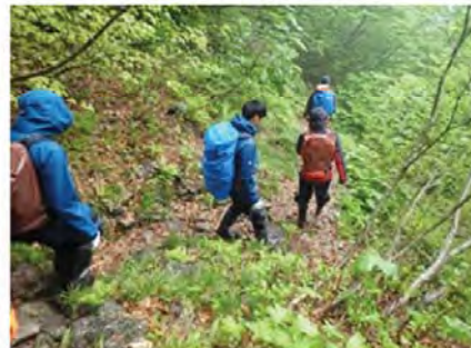
滑らないように下山