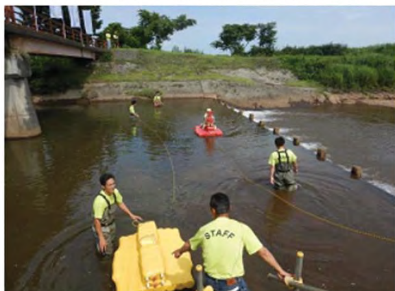
ペットボトルイカダ