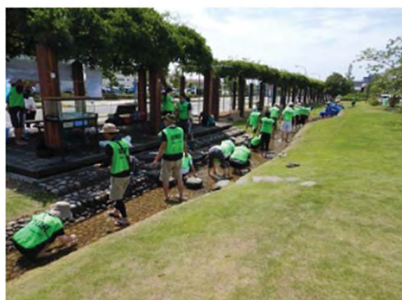
最後に、小石が落ちていないか確認です