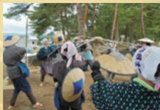
花笠踊り原型の築堤時の作業の様子

また、花笠踊り発祥の地である尾花沢地方に伝わる俗に「笠回し」と言われる踊り方は、徳良湖の灌漑用水池工事で歌われた土突き作業の後ろで、笠をおおいで風を送るしぐさが原型とされています。