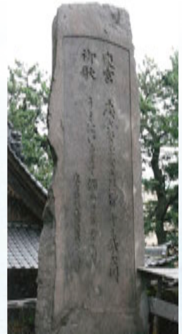
昭和天皇の歌碑 酒田市日和山公園