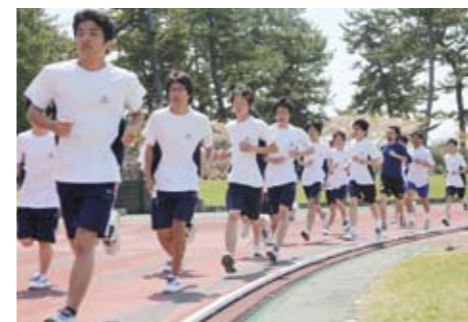
様々な学校行事を計画(写真はスポーツテスト)