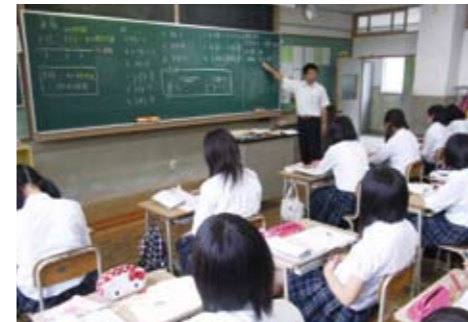
普通科の交流授業

酒田光陵高校は、充実した環境の中で、「公益」「国際化」「環境」「情報」の四つをキーワードに、未来を担うプロフェッショナルを育み、地域とともに成長する学校を目指します。また、スポーツ・文化活動の地域拠点校を目指して部活動の振興を図るとともに、地域の企業や高等教育機関と連携しながら、充実した教育を展開します。 この学校は、自分が生まれ育った郷土を大切に思い、高い志をもって、地域の発展を支えていく人づくりを目指します。