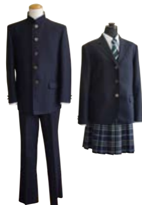
制服:濃紺の学生服・ブレザー

酒田中央高校の敷地と隣接地に新校舎を建設しています。ホームルーム教室のほかに、充実した設備を備えた専門学科の実習教室、三三〇名を収容できる公益総合学習室などを整備します。当分の間、酒田中央高校校舎の一部も利用します。また、学校生活をさらに充実させる部活動や学校行事についても多彩なものを用意しており、幅広い人との関わりを通して、切磋琢磨し、社会性を身に付けることができます。