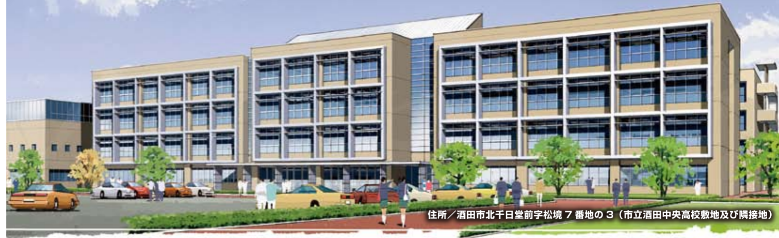
住所/酒田市北千日堂前字松境 7番地の3 (市立酒田中央高校敷地及び隣接地)

平成24年4月、県立酒田商業高校、県立酒田工業高校、県立酒田北高校、市立酒田中央高校が統合し、普通・工業・商業・情報の四つの学科を併せ持つ新高校「山形県立酒田光陵高等学校」が誕生します。