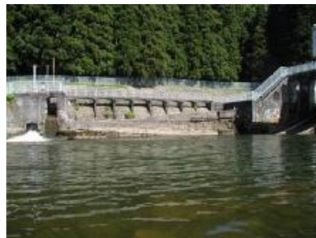
図2 赤川本流の現在の遡上限界である鶴岡市砂川地内の頭首工