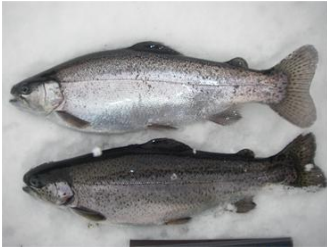
図1 ドナルドソン系ニジマス