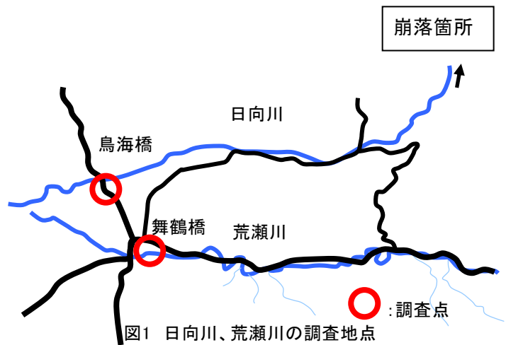
図1 日向川、荒瀬川の調査地点