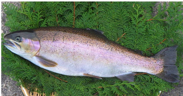
図1 ニジサクラ (2.5kg)