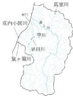
図1 産卵床調査河川位置図