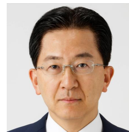
岩手県知事 達増 拓也