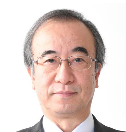
新潟県知事 花角 英世