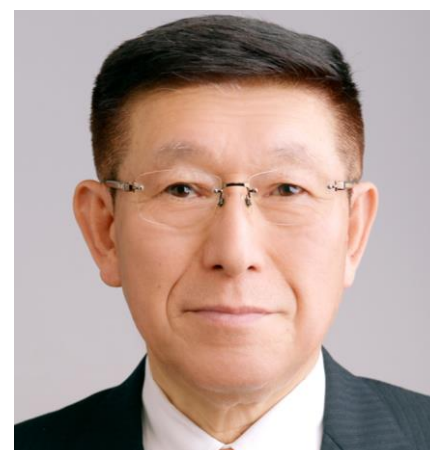
秋田県知事 佐竹 敬久