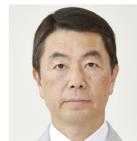
宮城県知事 村井 嘉浩