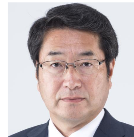
新潟市長 中原 八一