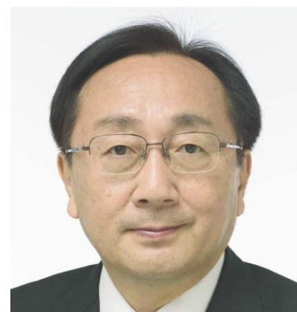
青森県知事 三村 申吾