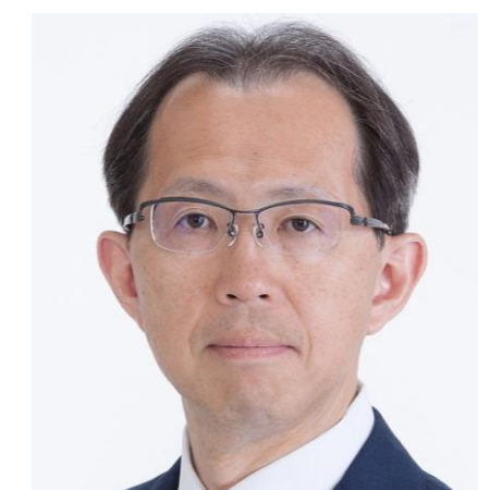
福島県知事 内堀 雅雄