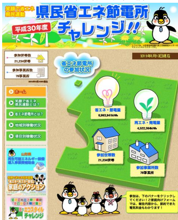
図 1-2 県民省エネ節電所

ホームページでは、省エネルギー等の取組成果（取組みにより削減された電力量）を「省エネ・節電量」、再生可能エネルギー設備の導入成果（導入設備の発電量）を「再エネ発電量」として市町村ごとに集計し、合計値を電球の大きさ・数で表現しています（図1-2、表1-5）。