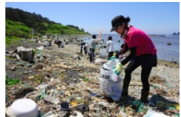
酒田市飛島の海岸での漂着ごみ