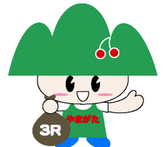
ごみゼロやまがた 県民運動キャラクター 『ごみゼロくん』