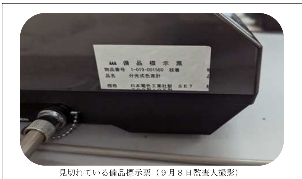
見切れている備品標示票（9月8日監査人撮影）

加えて、備品に貼付されている備品標示票（物品番号1-019-001560）について、印刷不備により内容の一部が記載されていなかった。