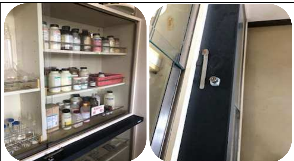
本館2階実験室毒劇物保管庫

（4）毒物及び劇物を取り扱う必要のない従業員や部外者がかぎを入手及び使用できないようにすること。また、かぎの管理者又は代理者が不在時においても、同様の管理を実施すること。