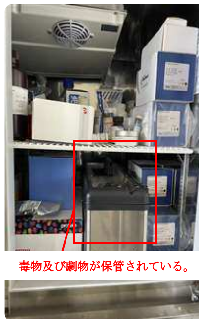
毒物及び劇物が保管されている。