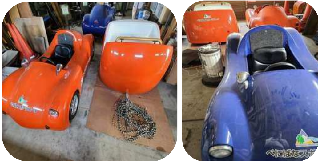
第2車庫内で発見した未返却の電動ミニカー（8月1日監査人撮影）